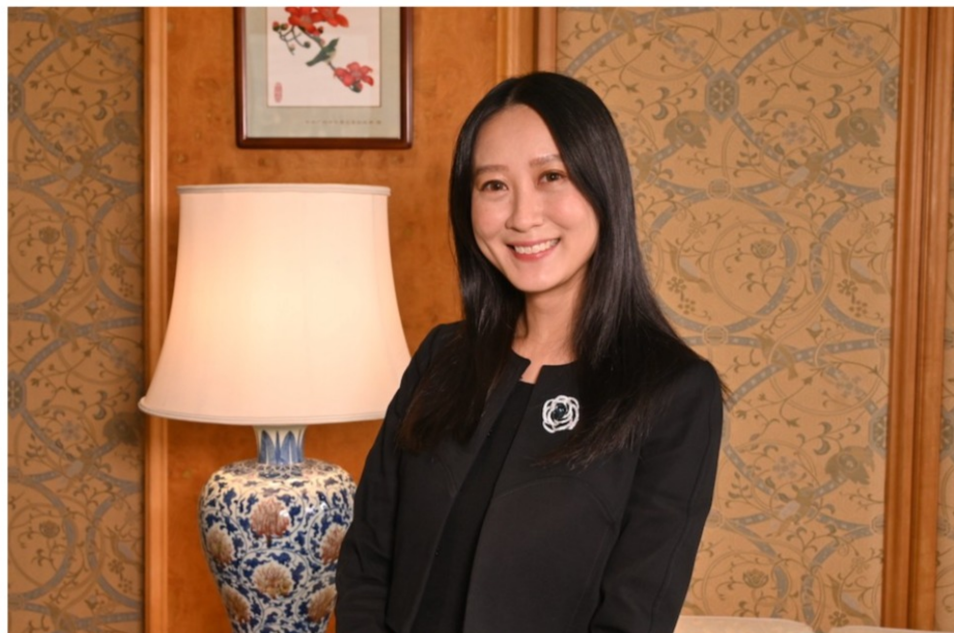
黃律師指出授權人能在「精靈」時，以「持久授權書」委任可信任的人士，在其失去精神行為能力時代為處理財務。

而在香港法例《持久授權書條例》下，任何人都能使用「持久授權書」。授權人可在「精靈」時，預先委任一位或多於一位可信任的人士，在其失去精神行為能力時代為處理財務。此舉可避免自身失去精神行為能力時，家人因處理其財務問題而帶來的問題。